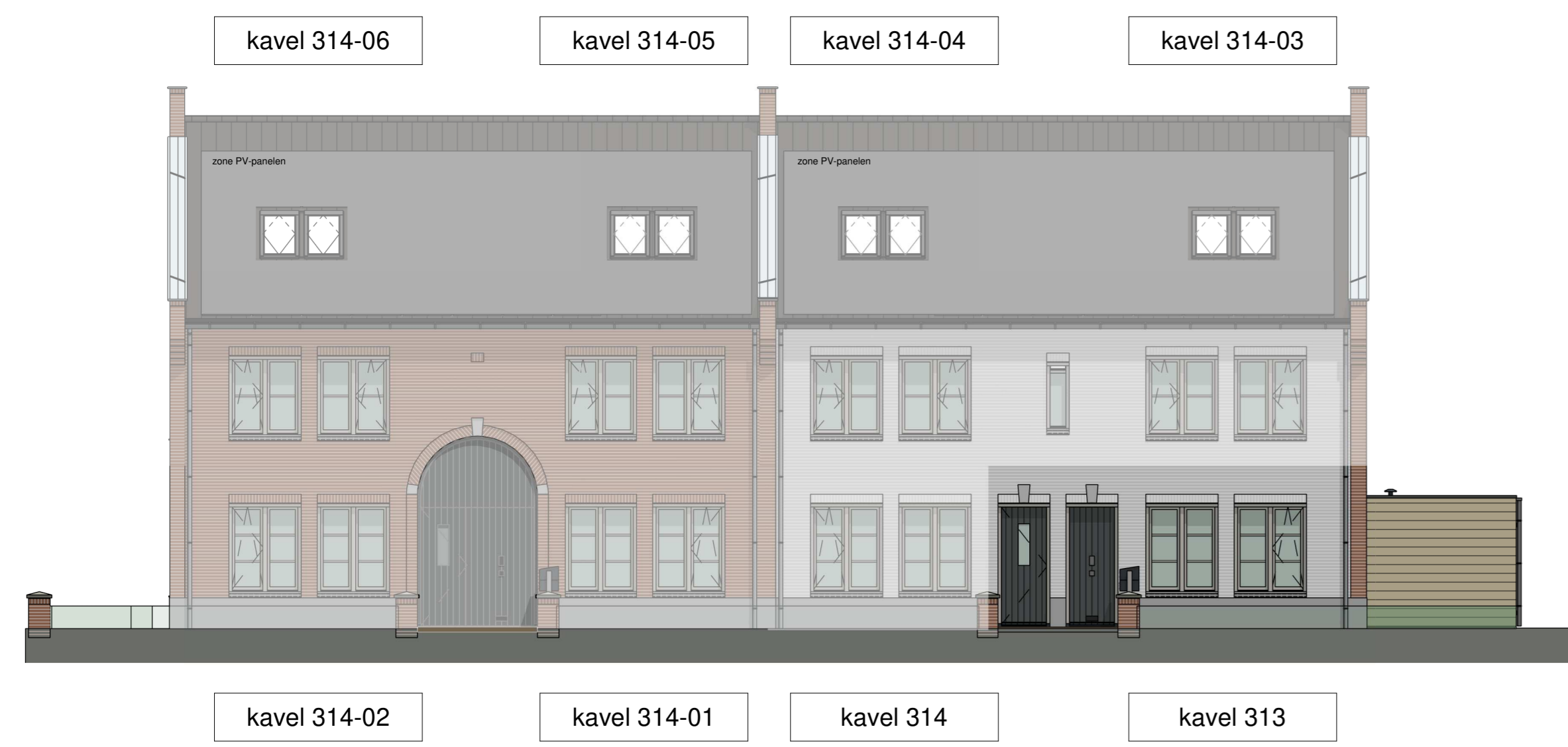
voorgevel (schaal 1 : 100)