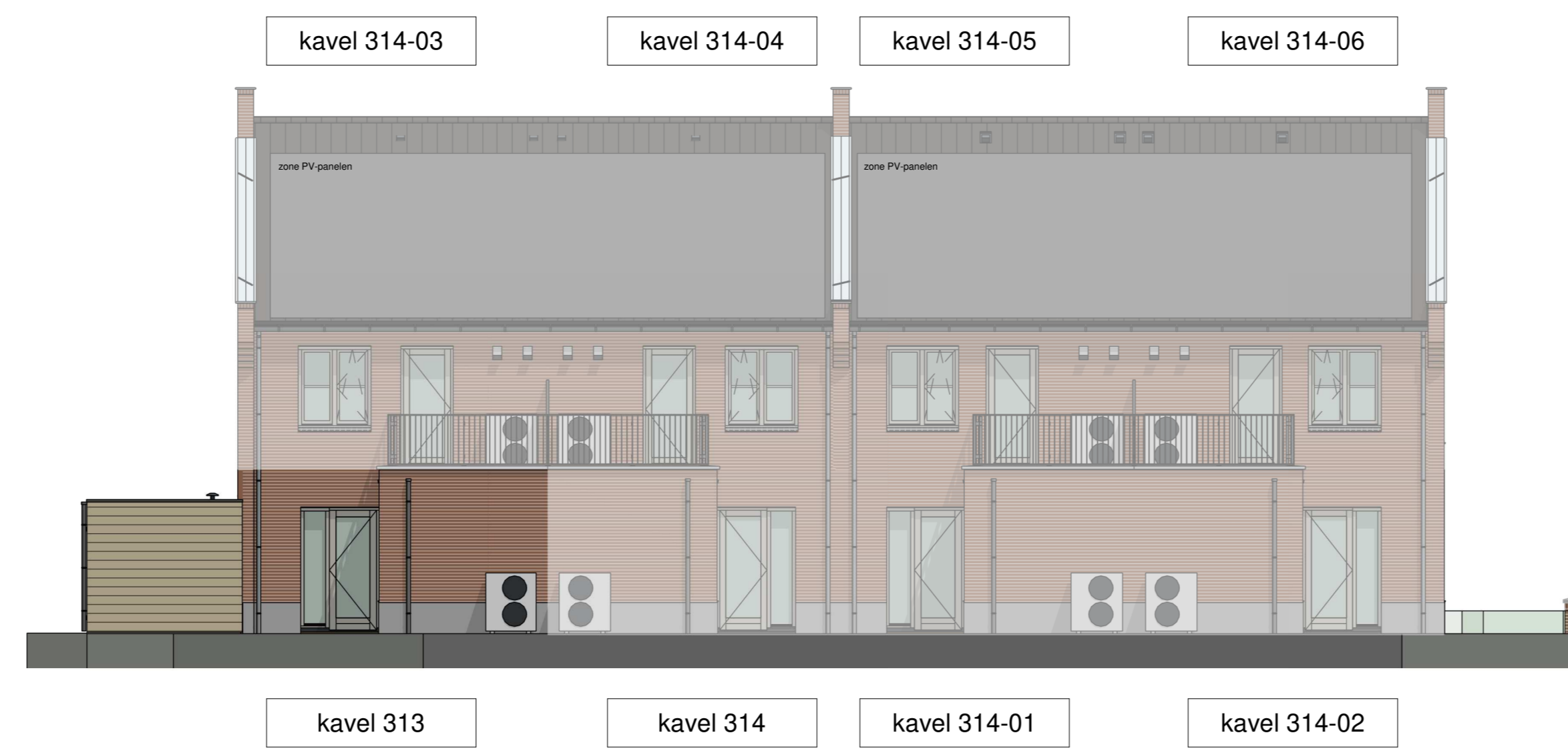
achtergevel (schaal 1 : 100)