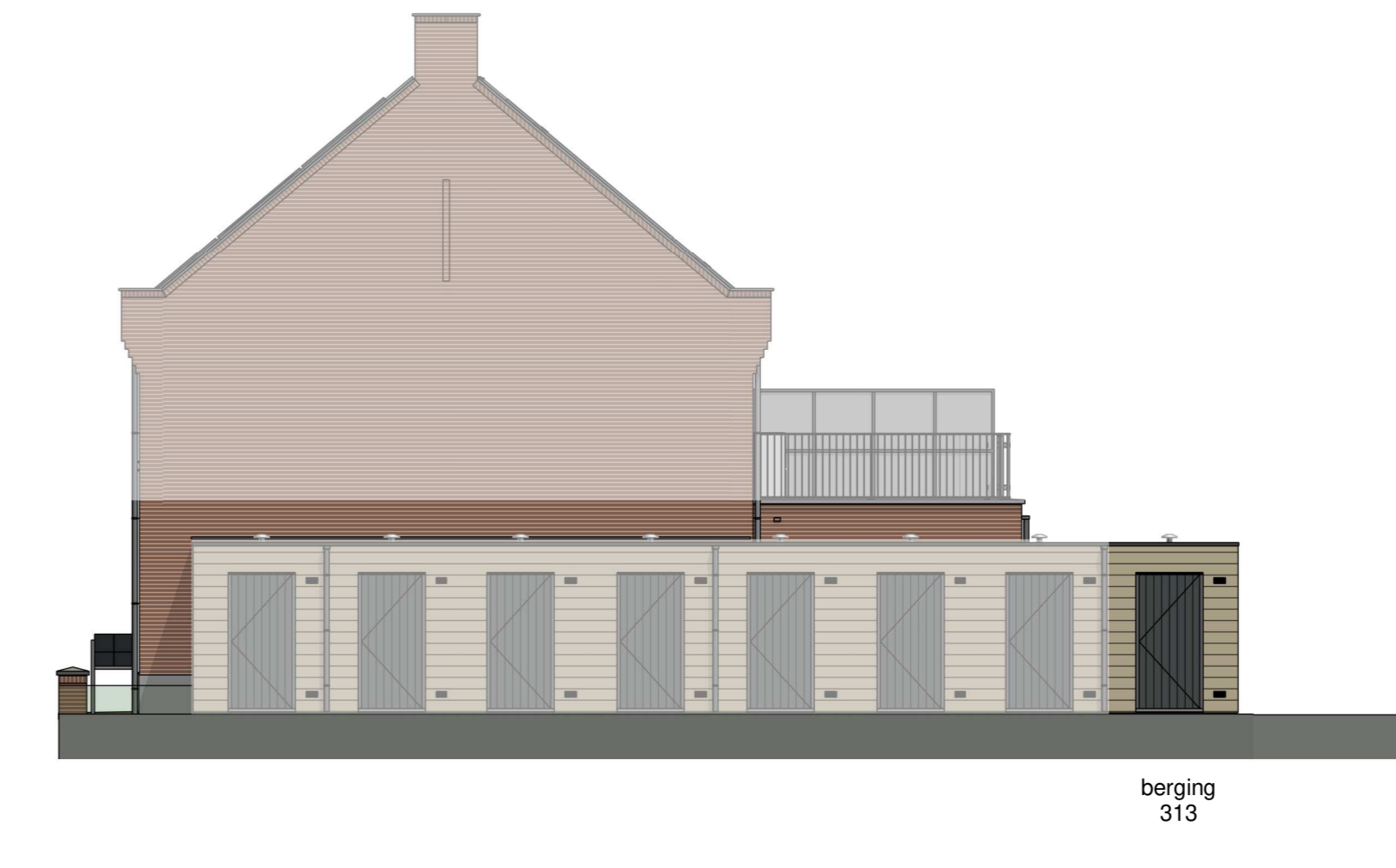
rechtgevel (schaal 1 : 100)