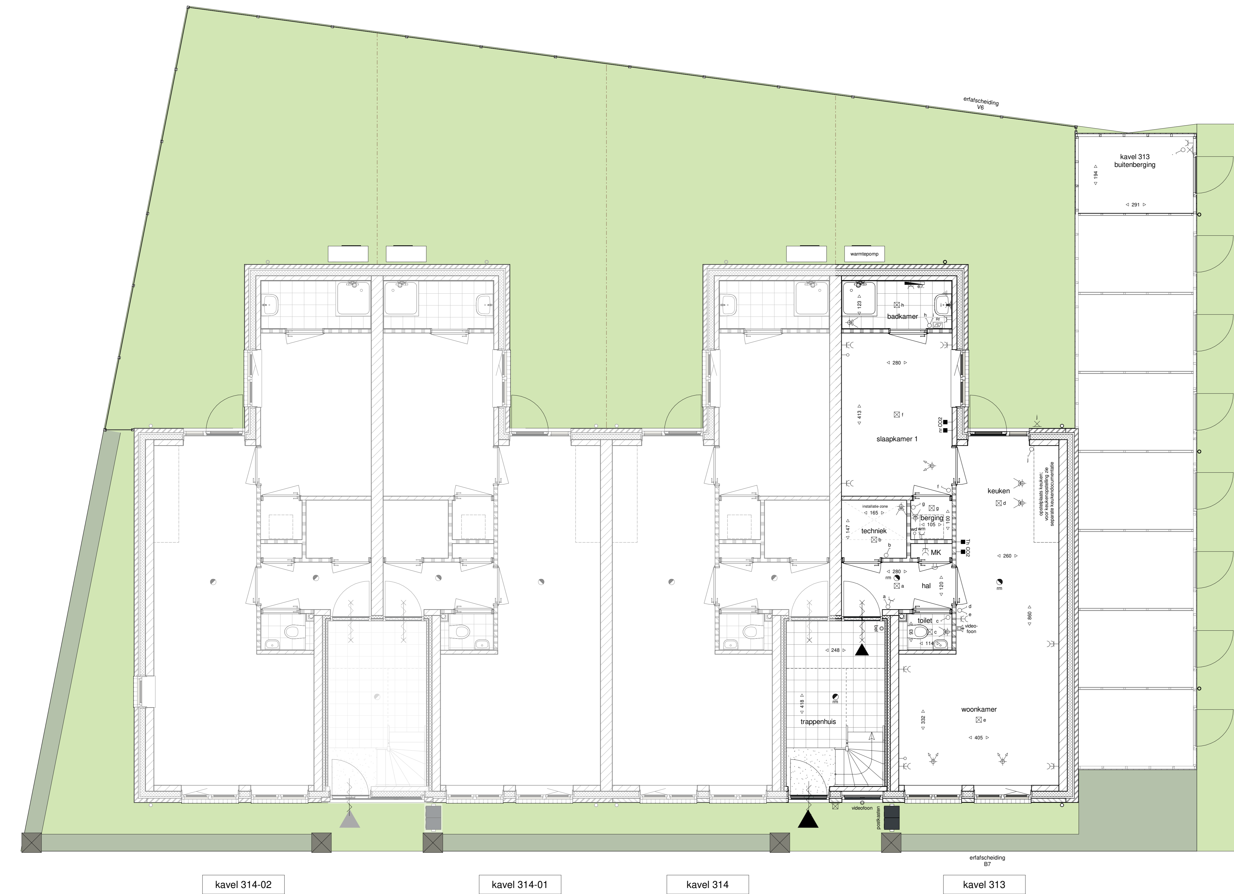
begane grond (schaal 1 : 50)