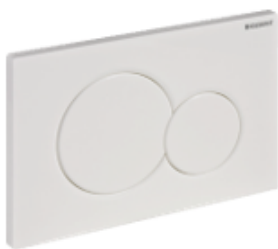
Geberit Sigma 01 Bedieningspaneel wit