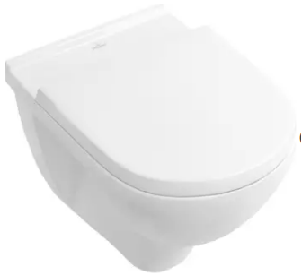
V&B O.Novo wandcloset met zitting