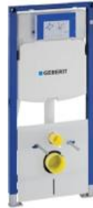
Geberit Duofix inbouwreservoir