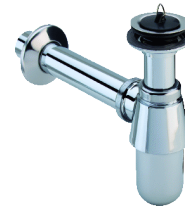
Viega Project plugbekersifon 366681