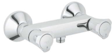
Grohe Costa L douchekraan 26330001