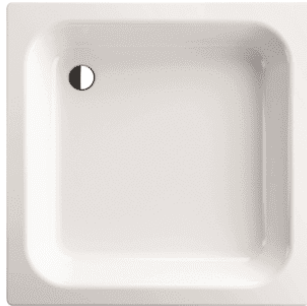
Bette douchebak 90x90x15cm 5900000