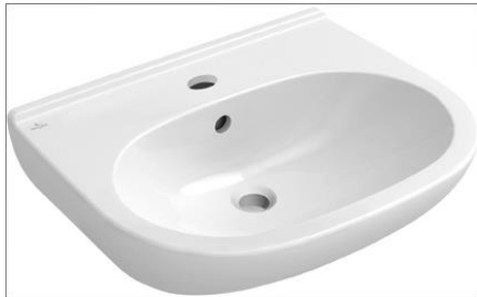
V&B O.Novo wastafel 60cm 51606001