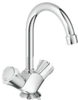
Grohe Costa L wastafelkraan 21337001