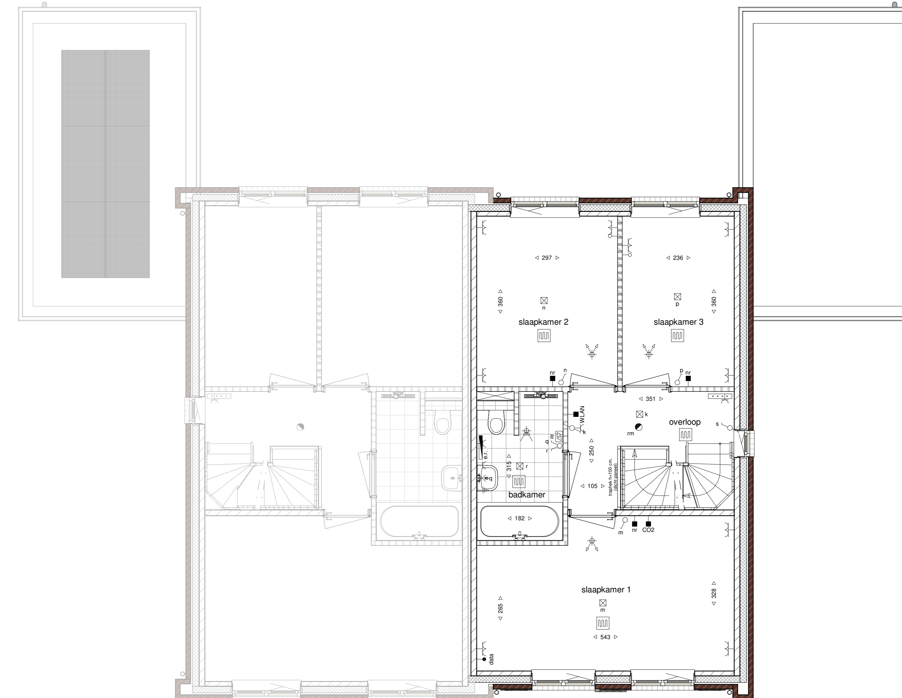
eerste verdieping 1 : 50