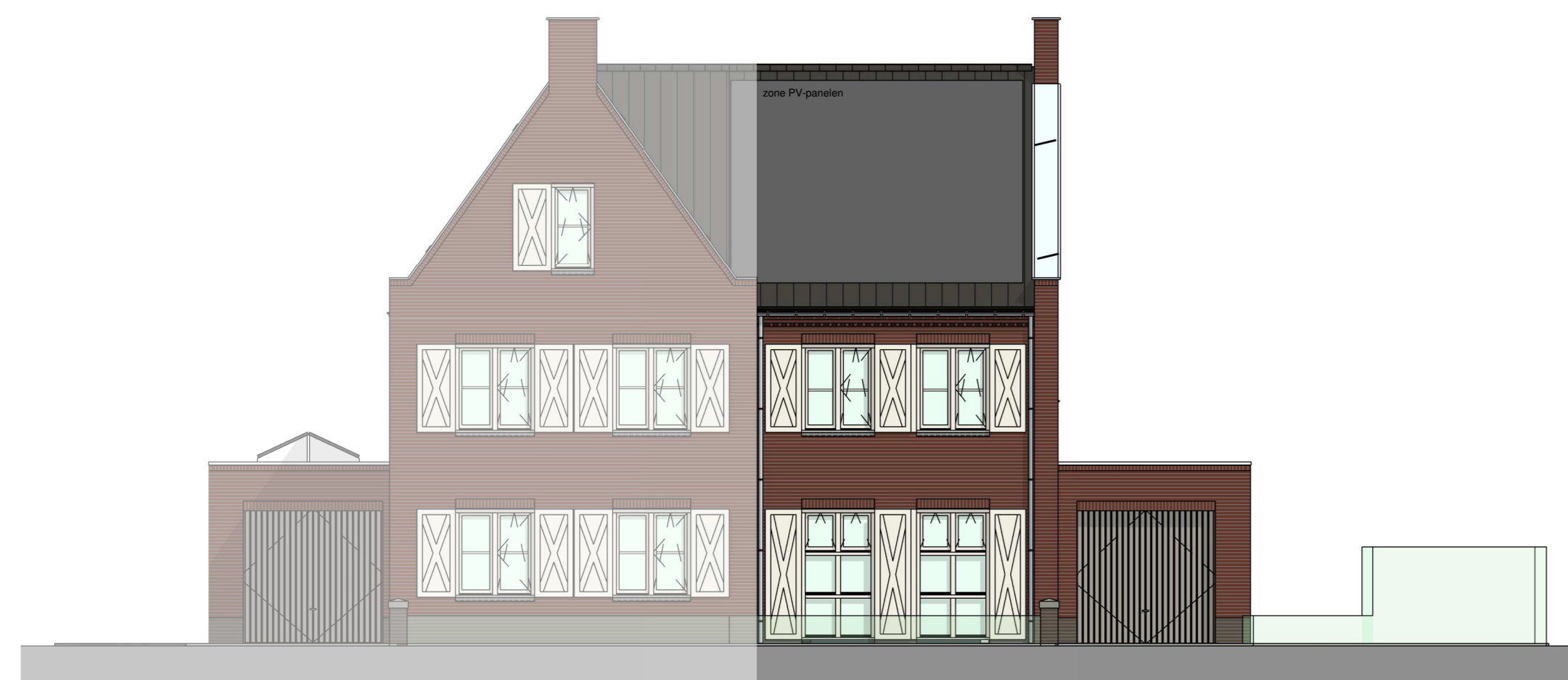
voorgevel 1 : 100