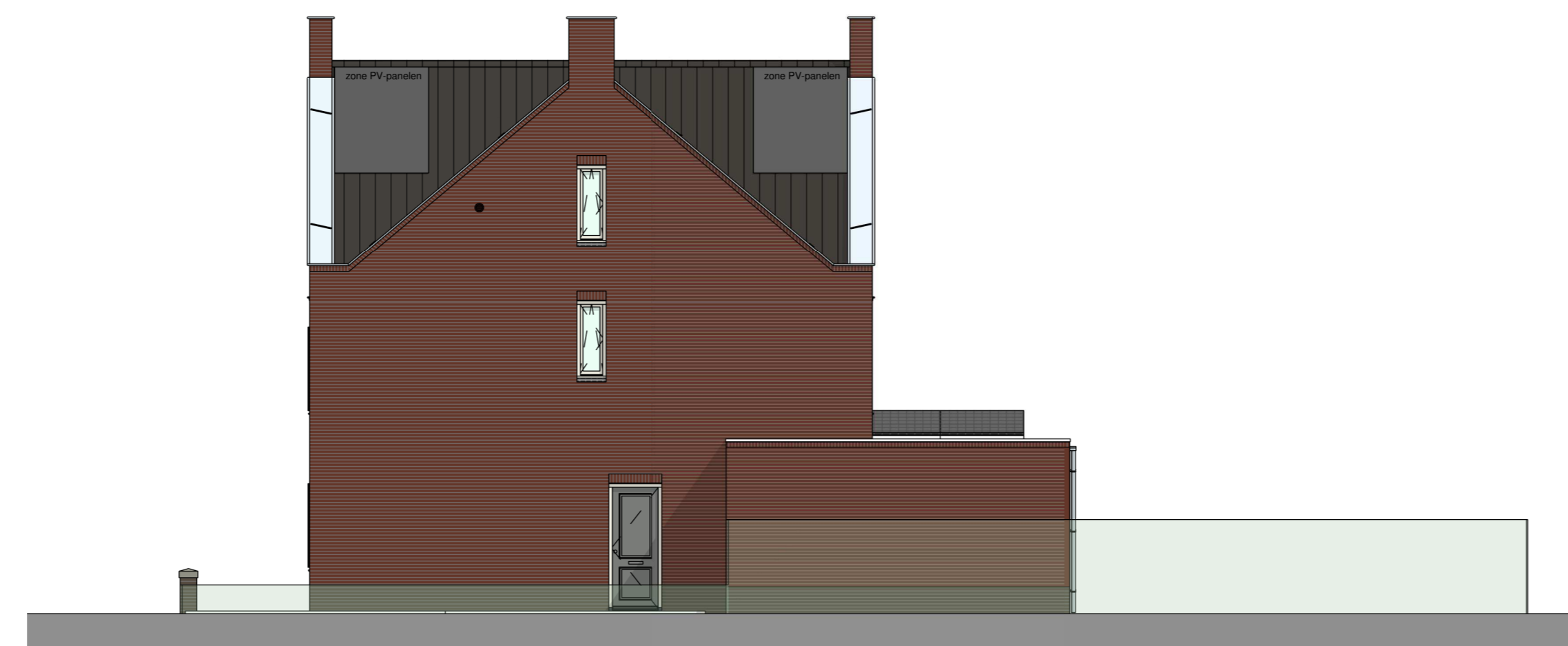
zijgevel rechts 1 : 100