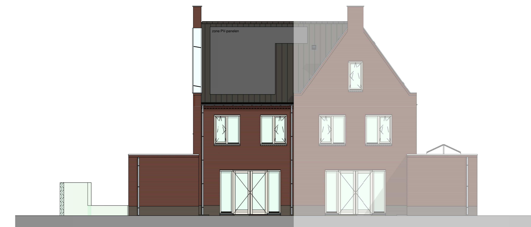
achtergevel 1 : 100