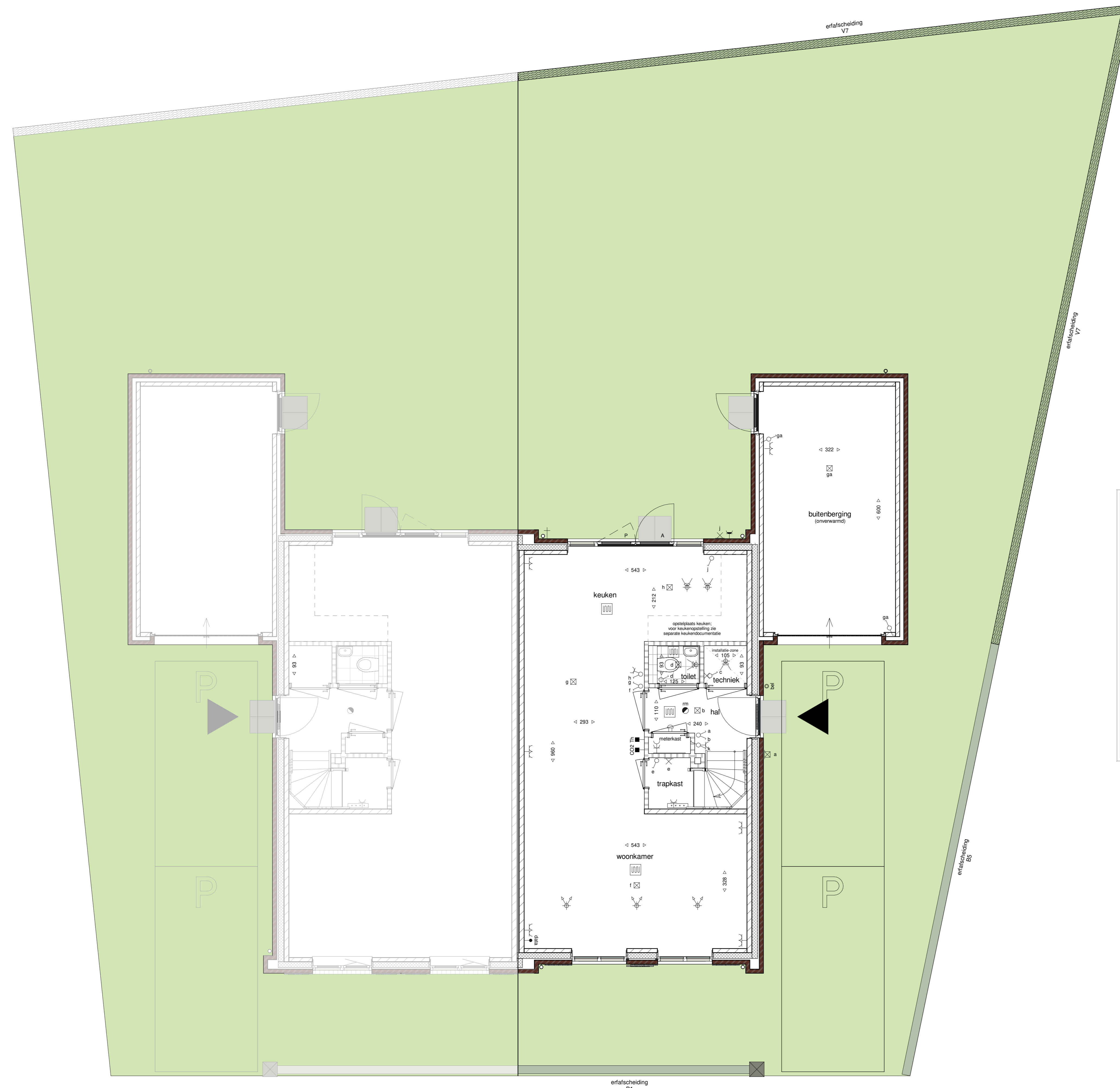
begane grond 1 : 50