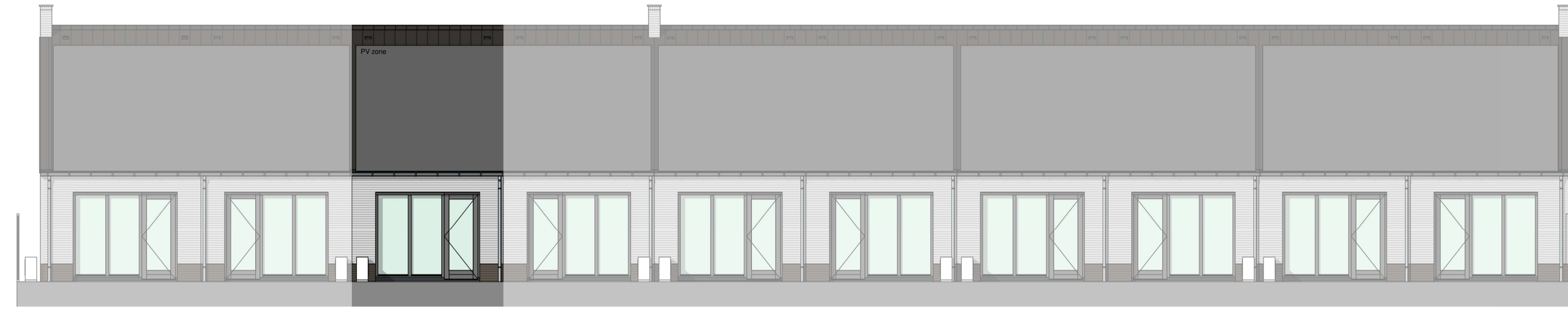
achtergevel 1 : 100