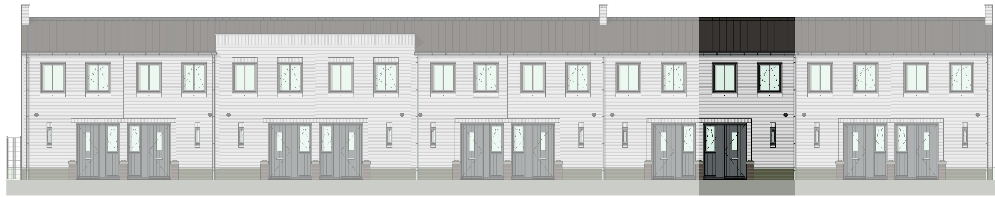
voorgevel 1 : 100