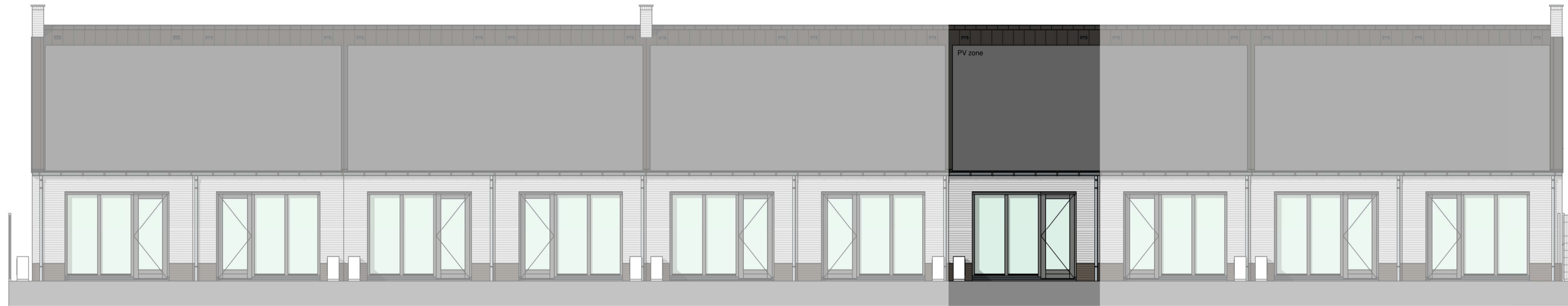
voorgevel 1 : 100