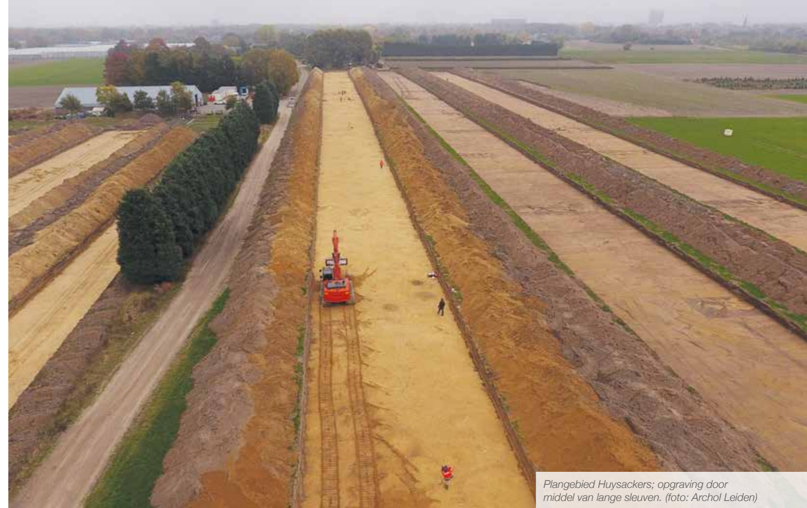
Plangebied Huysackers; opgraving door middel van lange sleuven.