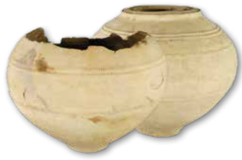
Bodemvondsten uit Oerle-Zuid; de twee dolia en de inhoud onder een röntgenapparaat

Kortlang zorgden voor veel belangstelling, zelfs uit het buitenland. De 'buit' bestond vooral uit zogeheten grafbijgaven die mensen na hun dood meekregen: schilden met ijzeren knoppen, zwaarden en messen, lansen, munten, mantelspelden, gespen en aardewerken potten. "De metalen voorwerpen liggen nu in het restauratieatelier in een ontzoutingsbad. Daar liggen ze wel een jaar in voordat we ze kunnen reinigen en restaureren."