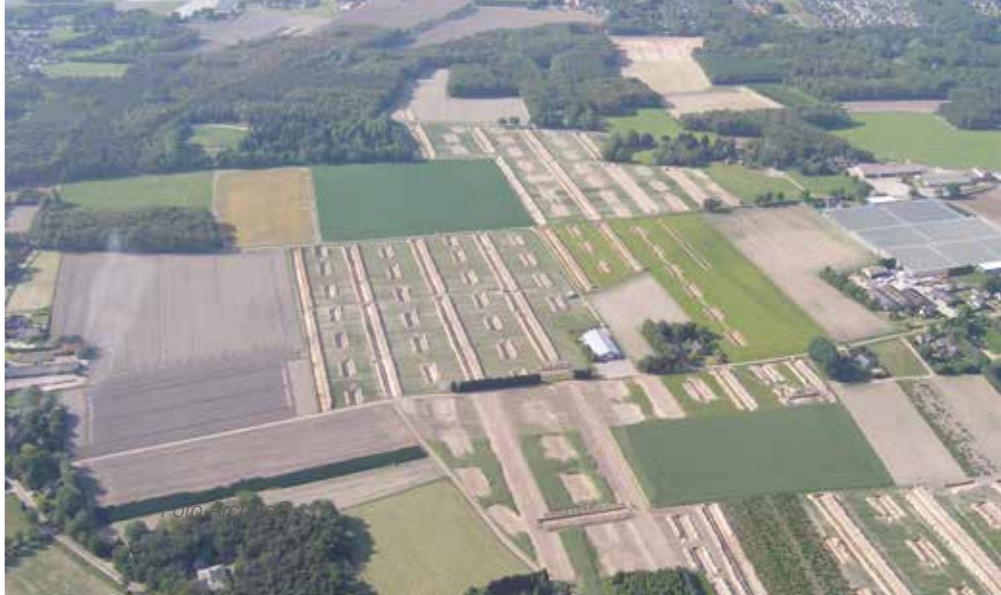
Omgeving Huysackers tijdens het proefsleuvenonderzoek in het gebied Zilverackers in 2010.

Duizenden jaren oude boerderijen, waterputten en een bijzonder grafveld