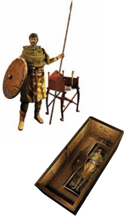
Reconstructie Merovingisch graf (afbeelding: Mikko Kriek)

Het grafveld werd snel omheind en met camera's bewaakt. Er volgden twee eneroverende weken, waarin het werk dankzij een webcam voor iedereen op internet te volgen was. De brede publiciteit en rondleidingen door Fokko